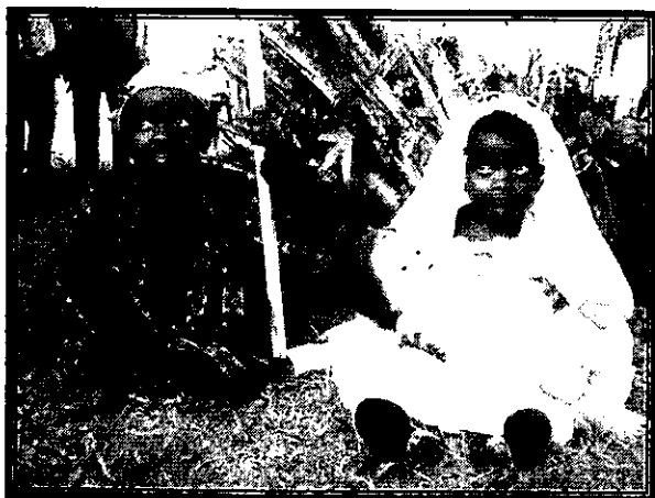
Jasełka na Madagaskarze